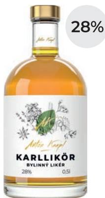
KARLLIKÖR BYLINNÝ LIKÉR