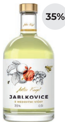
JABLKOVICE S MEDOVÝMI VÍČKY