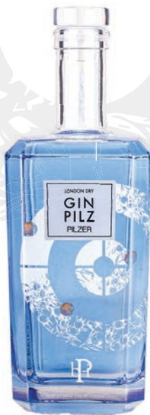
GINPILZ London Dry Gin 40%