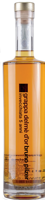
Bruno Pilzer Grappa Delmè d'or 43%