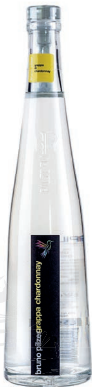
Odrůdové grappy 43%