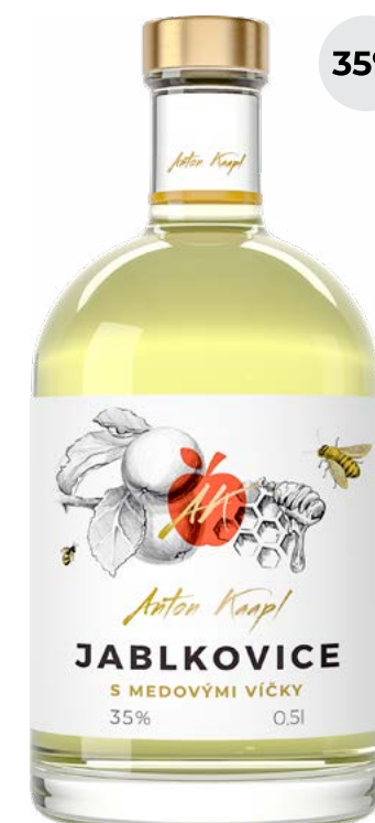
JABLKOVICE S MEDOVÝMI VÍČKY